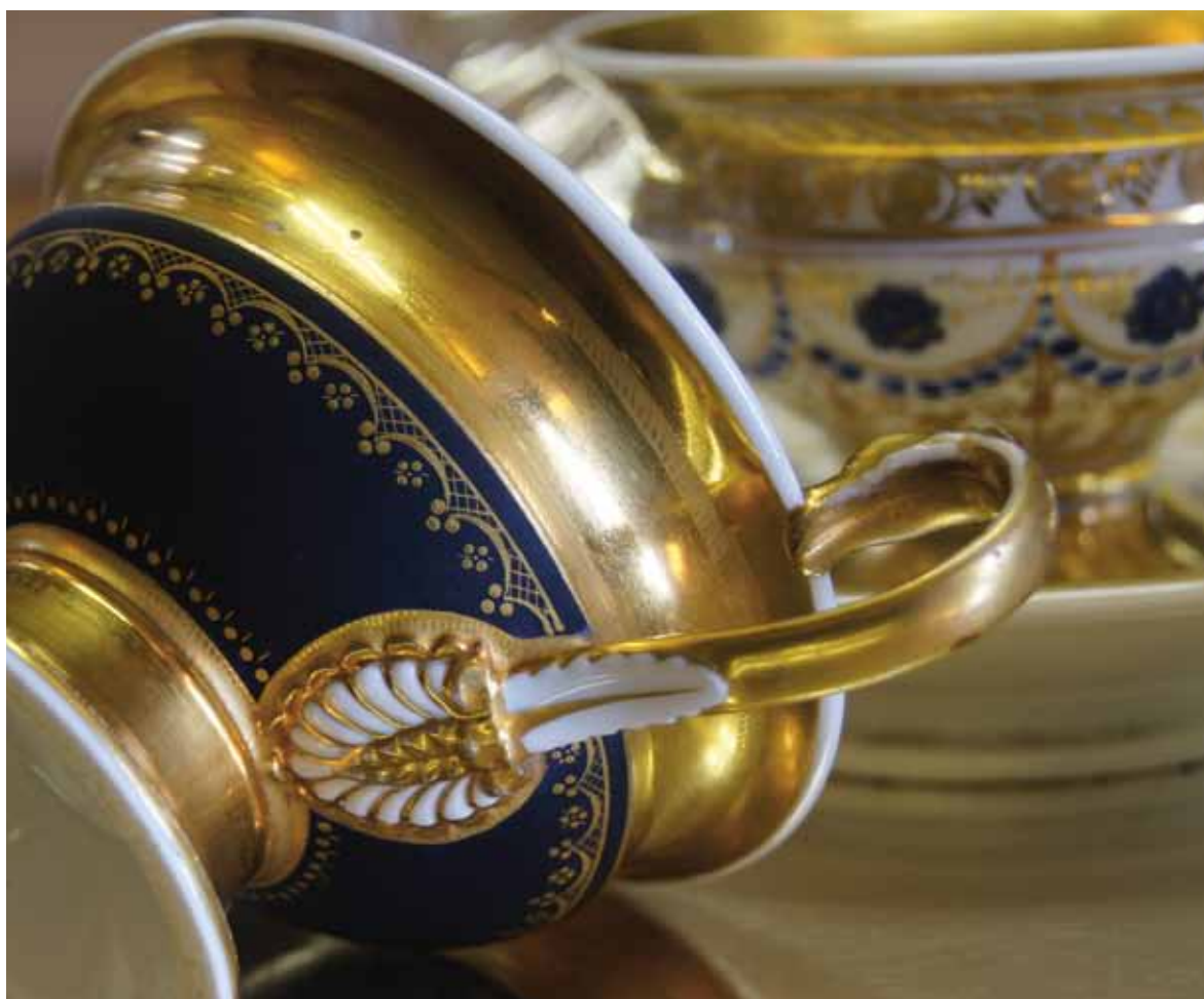
PORCELAINES DE LIMOGES. TRÉSORS DES COLLECTIONS PRIVÉES